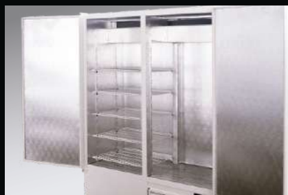
Wnętrze szafy dwukomorowej bez przegrody