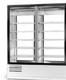
cm szer. 120 / 140 / 160 gł. 67,5 / wys. 198