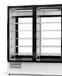
model 2SR ecoline / standard cm szer. 120 / 140 / 160 gł. 74 / wys. 200