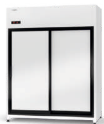
ecoline / standard model ZR/AG cm szer. 120 / 140 / 160 gł. 74,5 / wys. 202