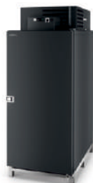
model CARGO mm szer. 780 / gł. 1190 / wys. 1340 / 2000