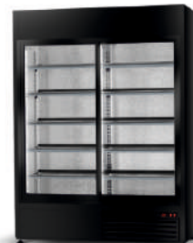
model SR/WH/BP cm szer. 120 / 140 / 160 gł. 74,5 / wys. 219