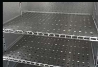
Nakładka perforowana, nierdzewna, szlifowana na półkę standardową