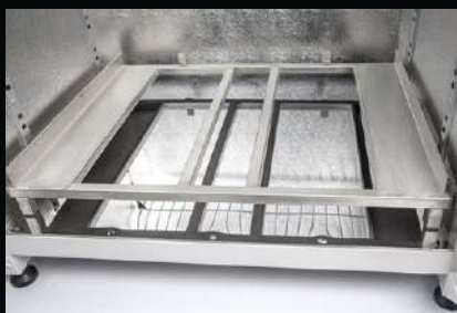
Podstawa pod pojemniki EURO 2 - dotyczy szaf o szer. 825 mm, 1600 mm