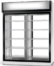
cm szer. 120 / 140 / 160 gł. 81 / wys. 202