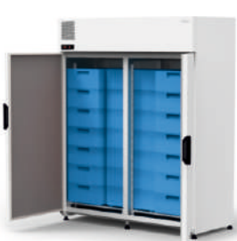
model 21-E2 ecoline / standard cm szer. 160 / gł. 80 / wys. 202