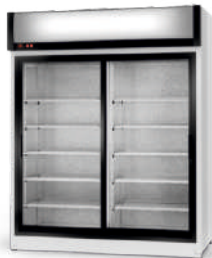
ecoline / standard model SR/AG cm szer. 120 / 140 / 160 gł. 79 / wys. 202