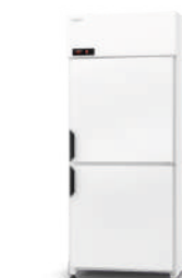
ecoline / standard model Z/AG/2D cm szer. 62,5 / 72,5 / 82,5 gł. 73 / wys. 202