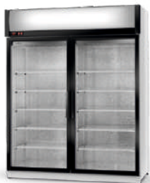
cm szer. 120 / 140 / 160 gł. 75 / wys. 202