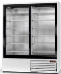
model SR ecoline / standard cm szer. 120 / 140 / 160 gł. 74,5 / wys. 198