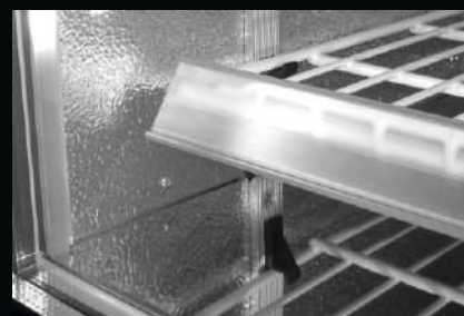
Listwa cenowa - bezbarwna