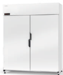
cm szer. 120 / 140 / 160 gł. 73 / wys. 202