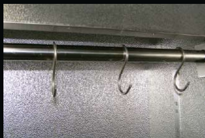
Belka na haki typu S - szafy jednokomorowe / dwukomorowe