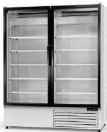
cm szer. 120 / 140 / 160 gł. 72 / wys. 200