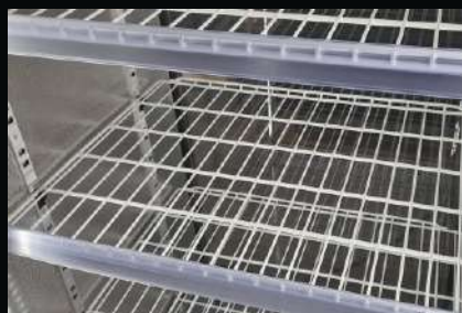
Półki żebrowane plastikowane standardowe - białe