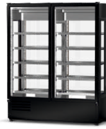
model 4S/NW/W/BP cm szer. 120 / 140 / 160 gł. 72 / wys. 200