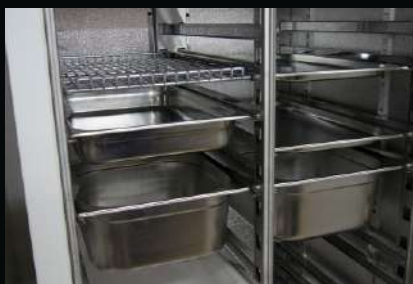
Przystosowanie urządzenia na pojemniki GN (1/1, 1/2, 1/3, 2/3) - dotyczy szaf o szer. 825 mm, 1600 mm (bez wentylatora)