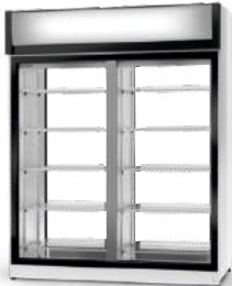
model 2SR/AG/1D ecoline / standard cm szer. 120 / 140 / 160 gł. 78 / wys. 202