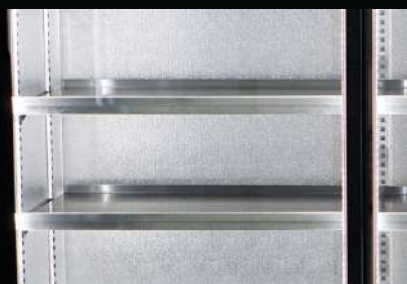
Półki pełne ze stali nierdzewnej