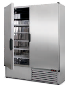
model Z/2N R-290 / ecoline / standard wnętrze ze stali nierdzewnej „lustro” korpus ze stali nierdzewnej „szlif”