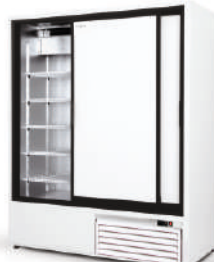
model ZR ecoline / standard cm szer. 120 / 140 / 160 gł. 74,5 / wys. 198