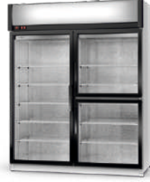
ecoline / standard model S/AG/3D cm szer. 120 / 140 / 160 gł. 75 / wys. 202