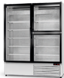
model S/3D ecoline / standard cm szer. 120 / 140 / 160 gł. 72 / wys. 200