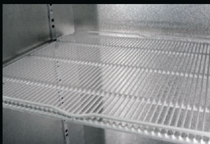
Półki żebrowane plastikowane gęste - białe