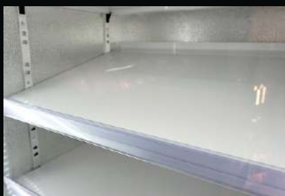
Półki pełne ze stali malowane proszkowo