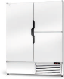
model Z/3D ecoline / standard cm szer. 120 / 140 / 160 gł. 73 / wys. 200