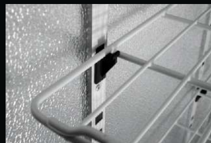
Wspornik do półek