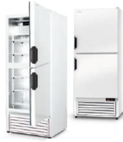
model Z/2D ecoline / standard cm szer. 62,5 / 72,5 / 82,5 gł. 73 / wys. 200