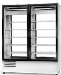
cm szer. 120 / 140 / 160 gł. 72 / wys. 200