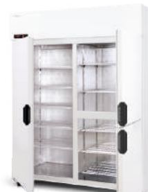
ecoline / standard model Z/AG/3D cm szer. 120 / 140 / 160 gł. 73 / wys. 202