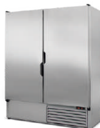
model Z/NZ R-290 / ecoline / standard korpus ze stali nierdzewnej „szlif”