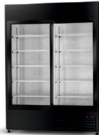
model SR/WH cm szer. 120 / 140 / 160 gł. 74,5 / wys. 219