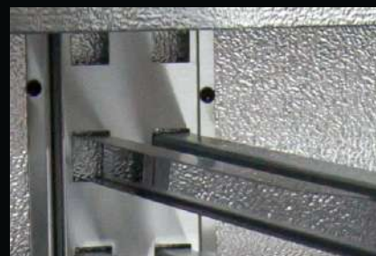
Prowadnica do pojemników GN