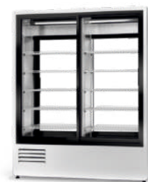
model 2SR ecoline / standard cm szer. 120 / 140 / 160 gł. 76 / wys. 198