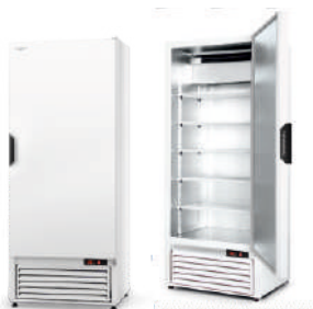
modele Z ecoline / standard cm szer. 62,5 / 72,5 / 82,5 gł. 73 / wys. 200