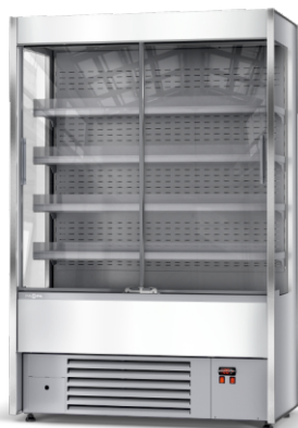
Regał chłodniczy przeszklony RCh-SR/133