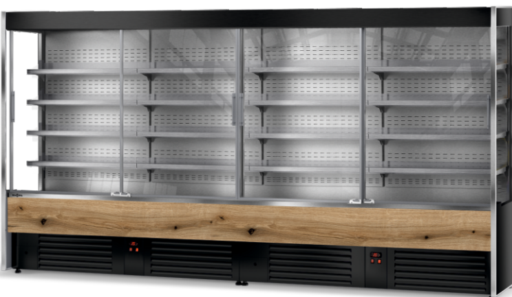
Ciąg 2 modułów regałów chłodniczych przeszklonych RCh-SR/196

front górny i dolny: RAL 9003 Biały sygnałowy wnętrze i cokół: RAL 7004 Szary sygnałowy bok: przeszklony z szarym wykończeniem