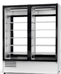
model 2SR R-290/ ecoline / standard