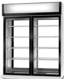
model 2S/AG/1D R-507 / standard