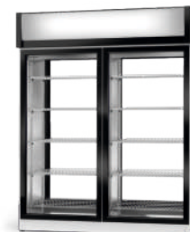
model 2SR/AG/1D R-507 / standard