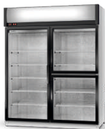
model S/AG/3D R-290/ ecoline / standard