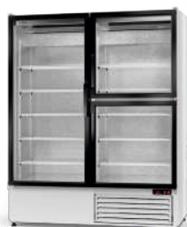
model S/3D R-290/ ecoline / standard