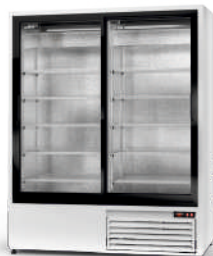
model SR R-290/ ecoline / standard