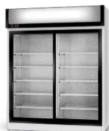
model SR/AG R-290/ ecoline / standard