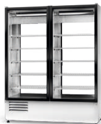
model 2S R-290/ ecoline / standard