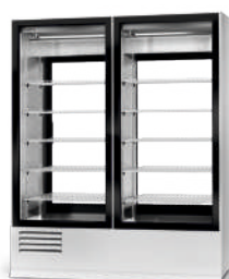
model 2SR/1D; 2S/1D R-507 / standard