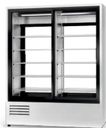
model 2S2R R-507 / standard