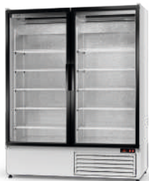
model S R-290/ ecoline / standard