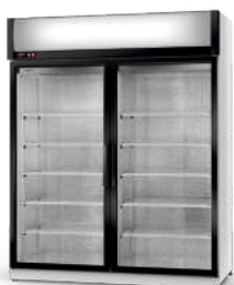
model S/AG R-290/ ecoline / standard