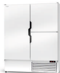
model Z/3D R-290 / ecoline / standard