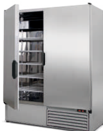
model Z/2N R-290 / ecoline / standard wnętrze ze stali nierdzewnej „lustro” korpus ze stali nierdzewnej „szlif”