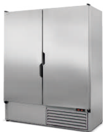
model Z/NZ R-290 / ecoline / standard korpus ze stali nierdzewnej „szlif”