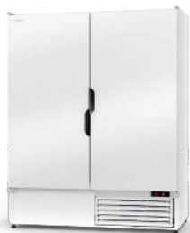
model Z R-290 / ecoline / standard