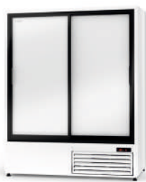
model ZR R-290 / ecoline / standard