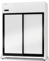
model ZR/AG R-290 / ecoline / standard