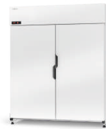
model Z/AG R-290 / ecoline / standard