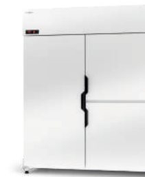
model Z/AG/3D R-290 / ecoline / standard